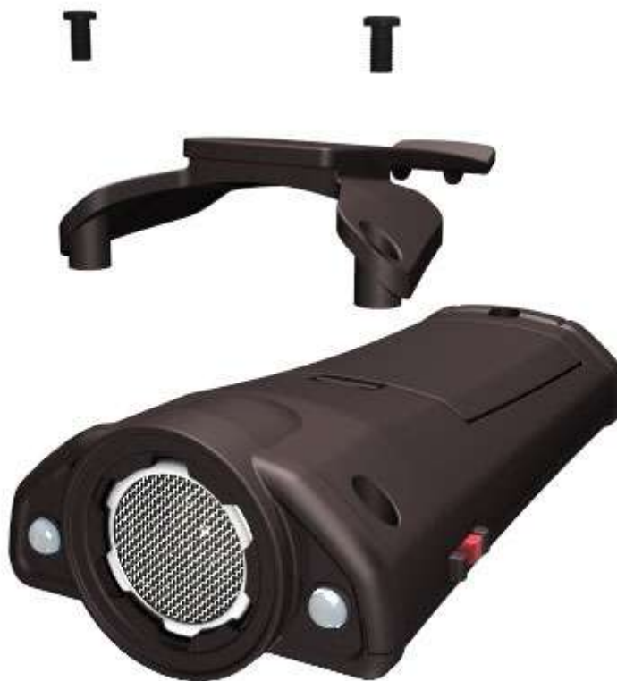
Рисунок 3 – схема установки клипсы

1.4.3 Клипса (поз. 8 рисунок 2), предназначенная для возможности закрепления изделия на пояском ремне, в состоянии поставки не установлена на корпусе изделия и может быть по желанию установлена самим пользователем, для чего в комплекте с изделием поставляются два самонарезающих винта увеличенной длины, которыми нужно заменить имеющиеся в корпусе. Схема установки клипсы представлена на рисунке 3.