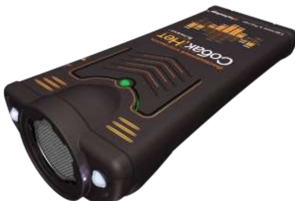
Рисунок 1. – внешний вид изделия

1.2.1. Внешний вид изделия показан на рисунке 1.